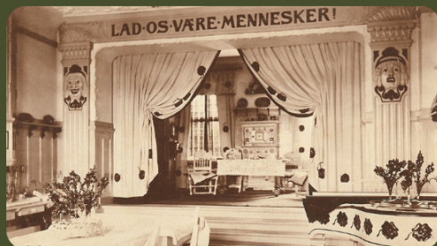
Spisestuen i palæet Solgården